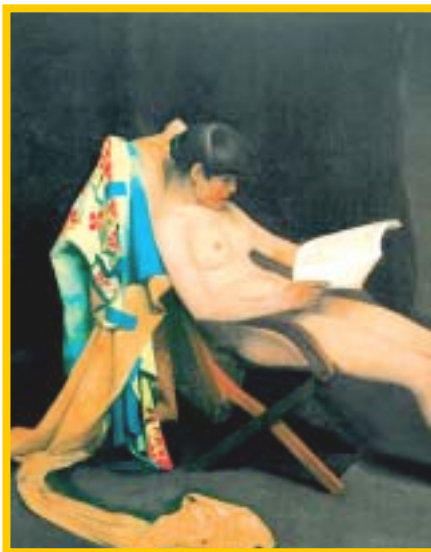
Muchacha leyendo , del pintor francés Théodore Rousel de 1887. Obra controversial para su tiempo.

Un magnífico libro de Stefan Bollman, que junto a una investigación cuidadosamente realizada, logra acompañar su texto con obras de arte de los grandes maestros, entre ilustraciones, pinturas y fotografías, en las que se presentan a cientos de mujeres hipnotizadas e invadidas por el apasionante hábito de la lectura..